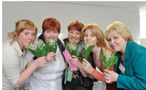
FEM NET teabekeskuste juhid seminaril Võrus 2007